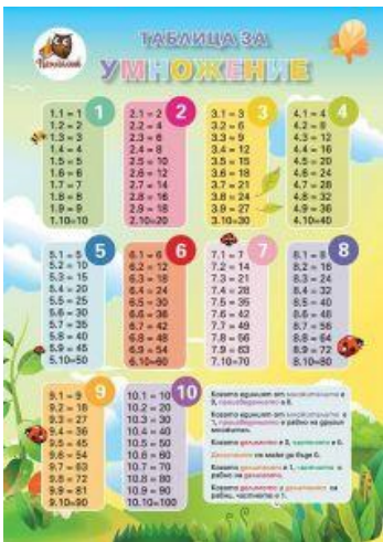
Таблица за умножение